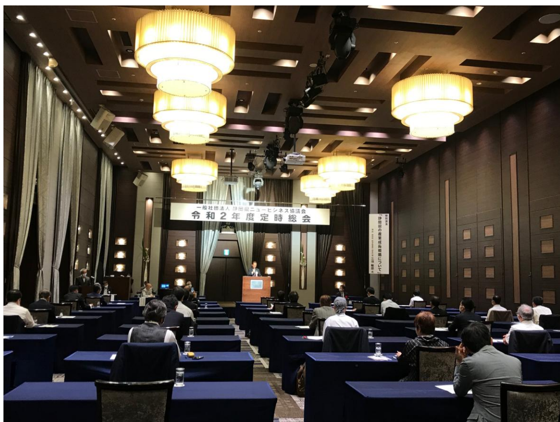
【総会の様子:机は全て1人掛けでソーシャルディスタンスを保ち開催しました。】

令和2年度定時総会には、多数の方々の御協力・御出席を頂き、誠に有難うございました。皆様のご協力により、提案された議事についても承認され、恙無く進行することが出来ました。改めて御礼申し上げます。