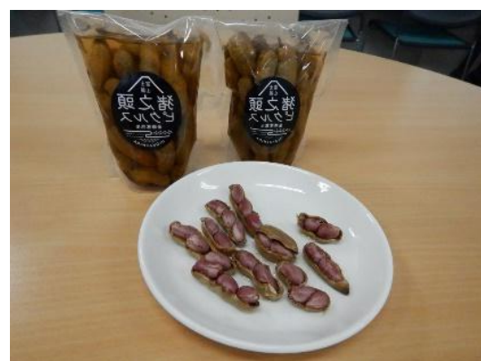
金時落花生の和ピクルス