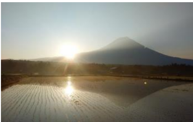
水田に映る逆さ富士