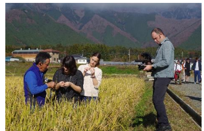
インバウンド PV 撮影