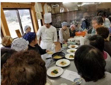
フローラディマール出張講座主催