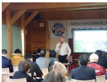
農泊推進セミナー主催