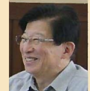
川勝 平太 静岡県知事